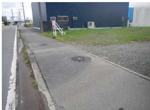
道路と敷地の関係 270 4-56