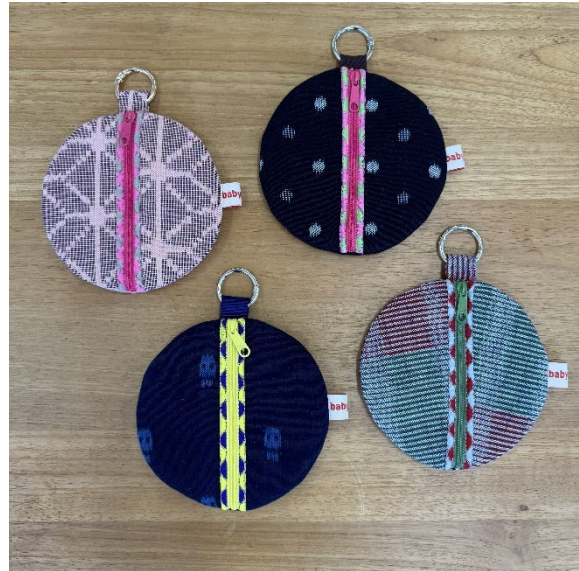
B【ロックミシンを使って久留米絣のテントウムシポーチ作り】