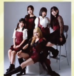
絨藍(アイ)ドル「あいくる」