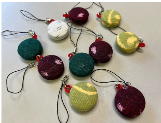
C【短時間で簡単！絣グッズ作り】