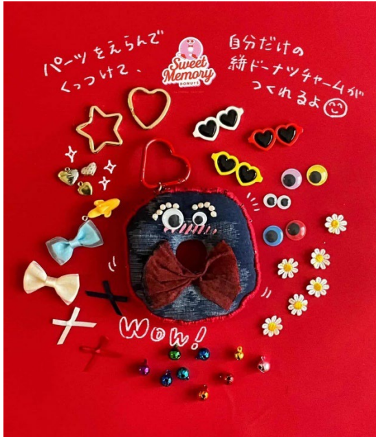
A【絣のドーナツチャーム作り】