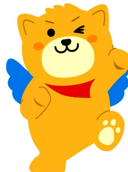
筑後市PRキャラクター はね丸