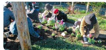
公園の緑化(みやま市) 有富地区