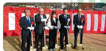
イベント(田川郡添田町) 第75回福岡県植樹祭