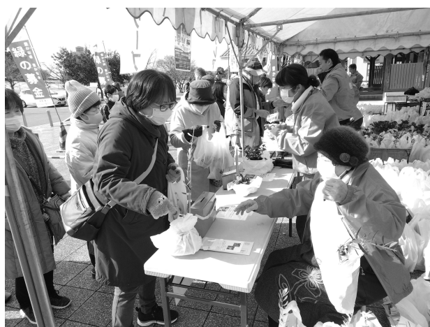
令和7年のキャンペーンの様子