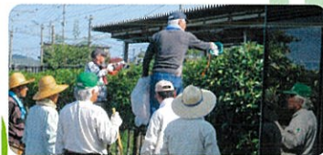
道路、公民館等の緑化(田川郡小竹町) JR小竹駅前樹木の整備