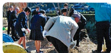
学校等の緑化(八女市) 黒木西小学校

緑の募金は「緑の募金による森林整備等の推進に関する法律」 に基づき(公財)福岡県水源の森基金が福岡県知事の 指定を受けて行っています。