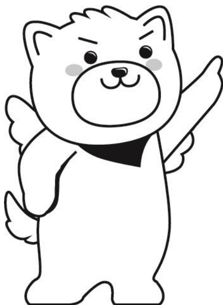
（筑後市PRキャラクター はね丸）