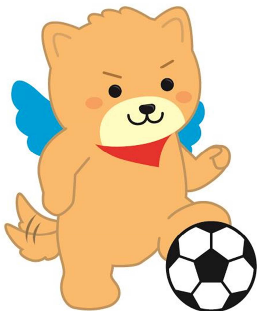
筑後市PRキャラクター はね丸