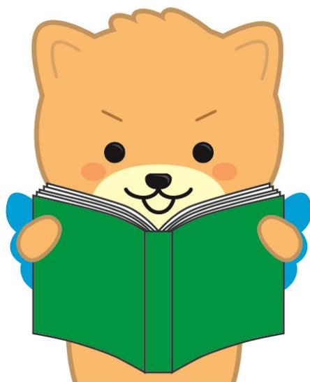
(筑後市 PR キャラクター・はね丸)