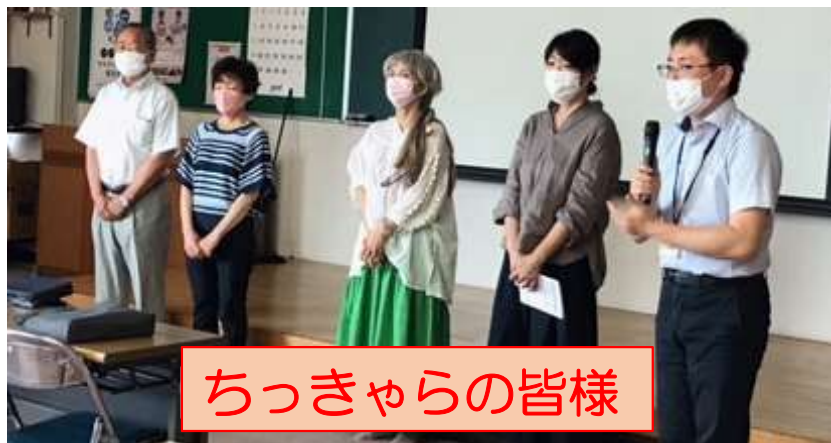
ちっきゃらの皆様

キャラバン隊より、発達障害、知的障害の疑似体験とエピソードトークをご紹介します！