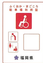
赤色（車椅子常時利用の身障者で自ら運転）