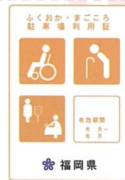
オレンジ色（妊産婦、けが人）