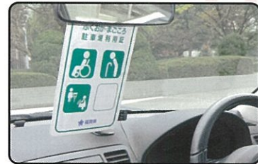
利用証をルームミラーに掛けて使用します