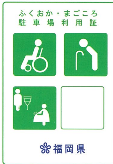
緑色（身体・知的・精神障害、高齢者、難病者）

(対象者・申請窓口は裏面をご覧ください。申請受付開始日は平成24年1月20日です。)