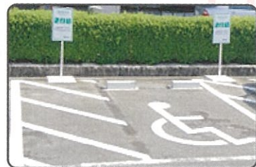
目印ステッカーが掲示してあるスペースで利用できます（A3サイズ）