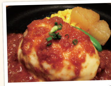
とろりチーズのハンバーグ 単品 ¥1,080(税込) セット ¥1,380(税込)