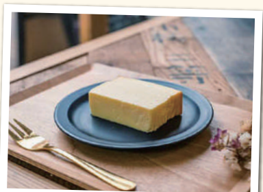
チーズケーキ単品 ¥440(税込) セットドリンク ¥230～(税込)