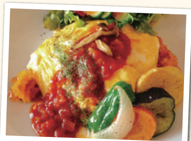
オムライス (スープ・サラダ付) ¥900(税込)