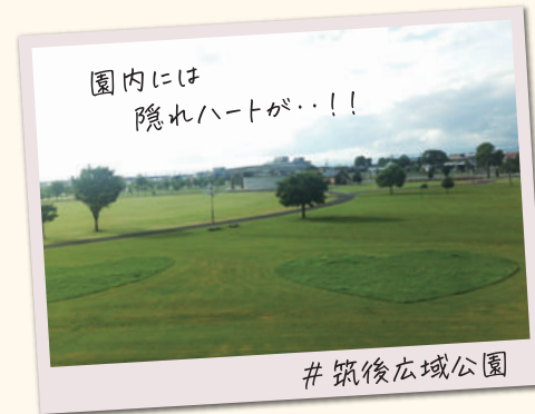
園内には 隠れハートが...!!