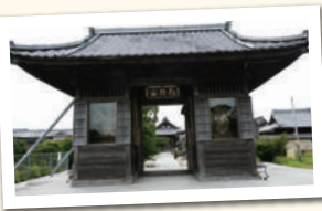
こうみやうじ 光明寺

寛元元年(一二四三年)、西牟田家綱により建立。本堂の天井絵は狩野左京之進によるもの。狩野左京之進は久留米藩御用絵師の家に生まれ、後に真木直人らと勤王活動に加わった。二十二通の中世文書「寛元寺文書」は県の有形文化財。