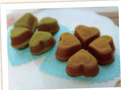
ハートのティーマドレーヌ (4個入) 500円(税込)