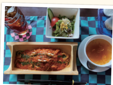
甕門の竹ペスタ ¥1,628(税込)