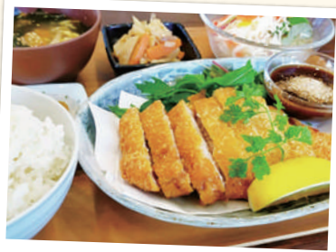
アグーのロースとんかつランチ ¥1,520(税込)

〒 筑後市久富1251-26 ☎ 0942-51-7730 🕒 11:00~15:00(OS 14:30) 17:30~22:00(OS 21:30) 🚫 休 火曜 🅓 あり