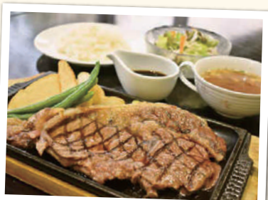
国産牛のサーロインステーキ 単品 ¥1,800(税込) セット ¥2,100(税込)~