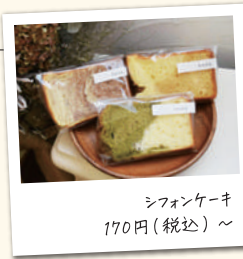
シフォンケーキ 170円(税込)~