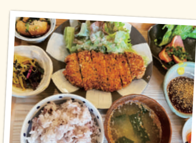
まんまんランチ ¥1,800(税込)