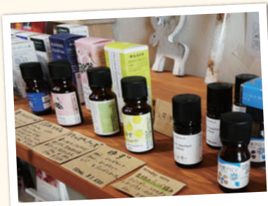
精油 (アロマオイル) 660円~(税込)