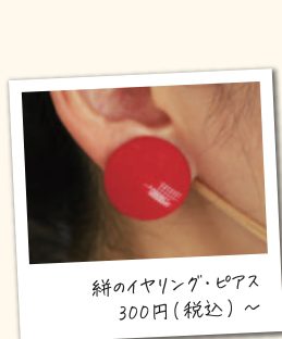
餅のイヤリング・ピアス 300円(税込)~