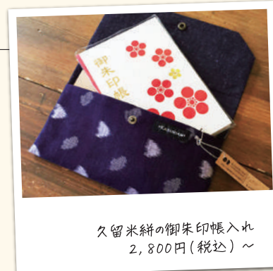
久留米餅の御朱印帳入れ 2,800円(税込)~