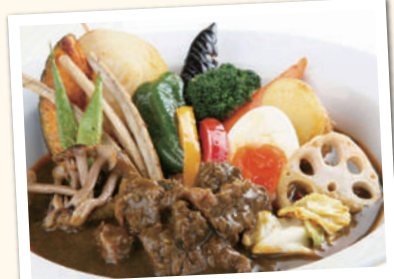
黒のドラキュラスープカレー ¥1,630(税込) ロースカツカレー ¥1,520(税込)