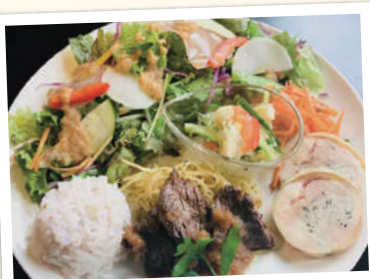
サラダプレート(ドリンク付) ¥1,100(税込)