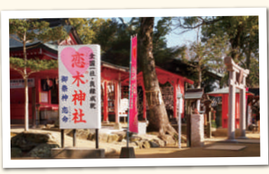
このぎじんじや 恋木神社(別名:木本社)

七八二年最澄の開基により創建という伝承を持つ。一三八年勸請の熊野神社とともに広川荘の中心として栄え、熊野神社は坂東寺の鎮守社となる。明治の神仏分離により、坂東寺は一旦廃寺となる。石造九重塔(県指定文化財)は貞永元年と筑後最古の紀年銘を持つ。