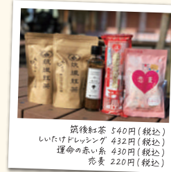
筑後紅茶 540円(税込) しいたけドレッシング 432円(税込) 運命の赤い糸 430円(税込) 苺麦 220円(税込)