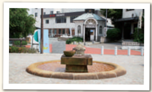
ふなごやこうせん 船小屋鉾泉

祭神である菅原道真(九〇三年没)の死後に、最初に建立された神社。一二六年に後堀川天皇の勅命により、菅原為長が建立した説が有力。水田の太宰府天満宮安楽寺隣に老松社(祭神・菅原道真)を創建したのが始まりとされる。本殿は一六七二年(寛文十二年)に上棟され、太宰府天満宮に似た造形となっており、天満宮と呼ばれるようになったのはこの頃からである。