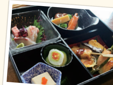
花野弁当 天麩羅セット ¥1,540(税込) ステーキセット ¥1,650(税込)