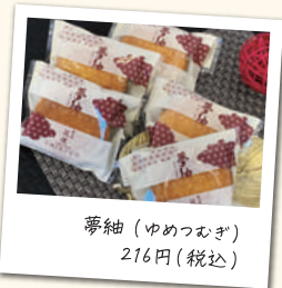
夢絨 (ゆめつむぎ) 216円(税込)