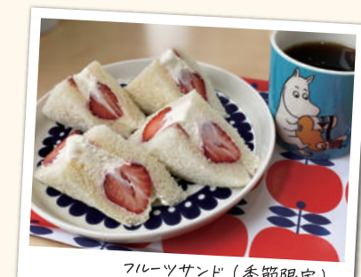
フルーツサンド (季節限定) (ドリンクセット) ¥770 (税込) ※写真はフィンランドコーヒー アップリパイ ¥198 (税込)