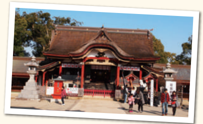
みずたてんまんぐう 水田天満宮

祭神である菅原道真(九〇三年没)の死後に、最初に建立された神社。一二六年に後堀川天皇の勅命により、菅原為長が建立した説が有力。水田の太宰府天満宮安楽寺隣に老松社(祭神・菅原道真)を創建したのが始まりとされる。本殿は一六七二年(寛文十二年)に上棟され、太宰府天満宮に似た造形となっており、天満宮と呼ばれるようになったのはこの頃からである。