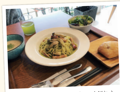
八女茶シフォンケーキ ¥800(税込) 八女茶のジェノベーゼ ¥1,100(税込) ※平日限定・数量限定