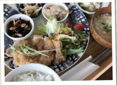
週替わり定食 (デザートセット) ¥1,800(税込)