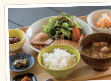
陽よりランチ ¥980(税込)