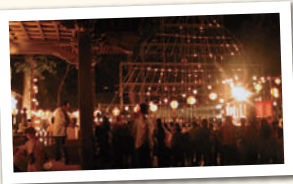
かまどじんじやせんとうみょう 竈門神社千燈明

水田天満宮の末社として建立当初より鎮座しており、「恋命(ここのみこと)」をお祀りした、全国一社の神社。恋木の由来はこの辺りの地名との説もあるが、木は、束を意味し、都に残した妻子を想いながら太宰府で生涯を結った菅原道真公の御靈魂を慰めようと祀られたとも言われている。現在では良縁成就の神様として、連日参拝客が訪れている。