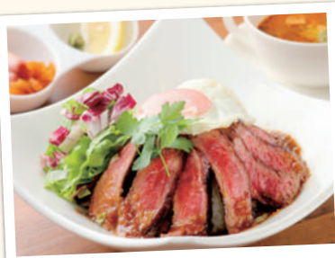
船小屋牛のステーキライス ¥1,595(税込)