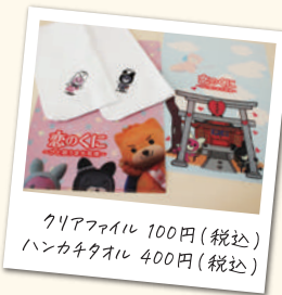
クリアファイル 100円(税込) ハンカチタオル 400円(税込)

ちっごのよか「みやげ」 「恋のくに筑後」に来たあなたへ。いちおしのおみやげが、 あなたの恋する気持ちを後押しします！