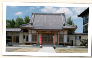
ばんどうじ 坂東寺

市内では最も古い伝承のある寺院。聖武天皇の勅願とされ、行基が開基(七二九年〜七四八年の間)、本尊の千手観音菩薩は行基による彫刻と伝えられる。当初は金光明寺と称された事から金光明寺と称したが、後に光明寺となる。石造九重塔(県指定文化財など、多くの文化財が残されている)。