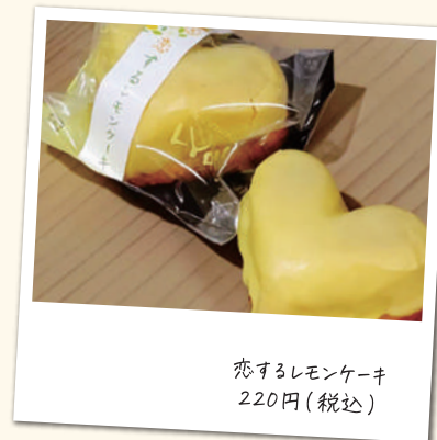
恋するレモンケーキ 220円(税込)