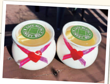
ふなごやプリン 385円(税込)