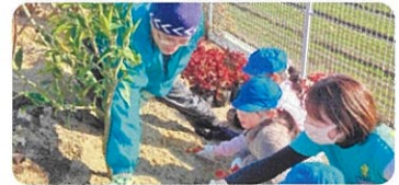
学校等緑化(久留米市) 園庭の緑化