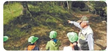
緑の少年団(篠栗町) 樹木観察会

緑の募金は「緑の募金による森林整備等の推進に関する法律」 に基づき(公財)福岡県水源の森基金が福岡県知事の 指定を受けて行っています。