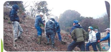
森林整備(香春町) 香春町での樹木植栽