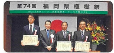
イベント(遠賀郡遠賀町) 第74回福岡県植樹祭