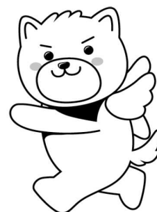
筑後市PRキャラクター・はね丸