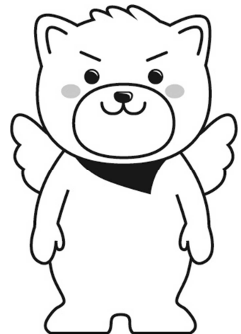
筑後市PRキャラクター・はね丸