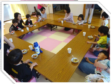
支援員さん手作りの、季節を感じる「サツマイモとリンゴ」のおやつもいただきました