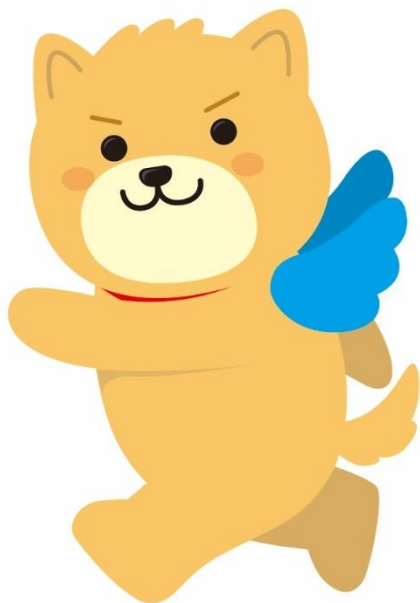
(筑後市 PR キャラクター・はね丸)