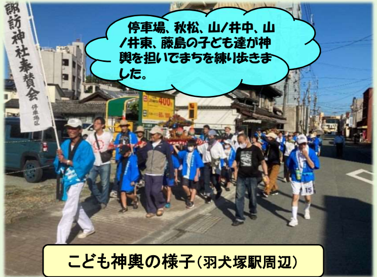
こども神輿の様子(羽犬塚駅周辺)