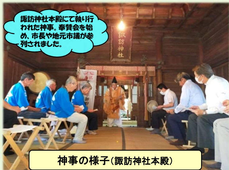
神事の様子(諏訪神社本殿)