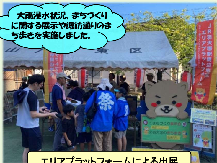
エリアプラットフォームによる出展