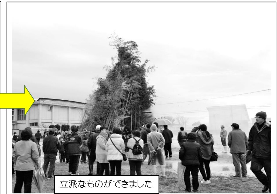
立派なものことができました