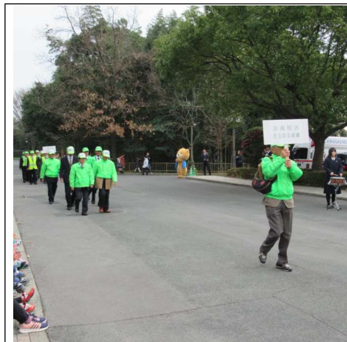
古島校区自主防災組織のパレードの様子