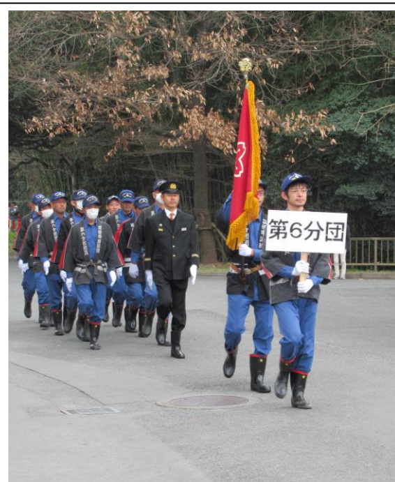
消防団第6分団（水田・古島）のパレード

1月7日（土）サザンクス筑後で行われた、新春筑後市出発式・新春のつどいに参加してきました。出発式では、永年勤続者の表彰などが行われた後、屋外で八女高校吹奏楽部の演奏に合わせ、消防・救急車両のパレード、消防署職員・消防団の方などによる「隊列行進」や「一斉放水」などが行われました。今年は、当協議会もパレードに参加しました。