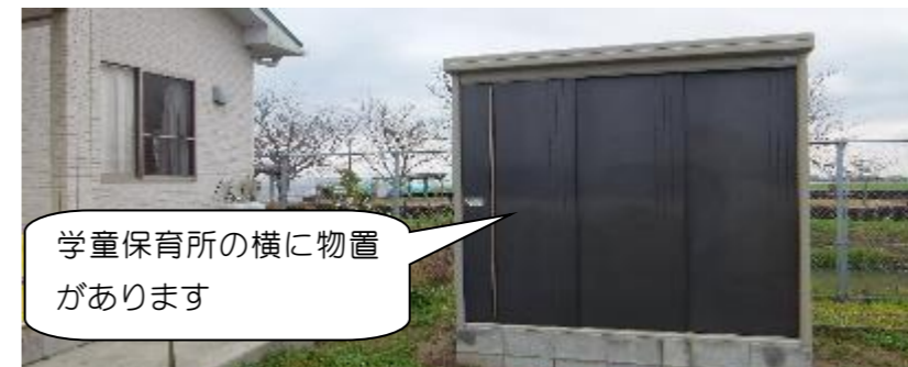
学童保育所の横に物置 があります