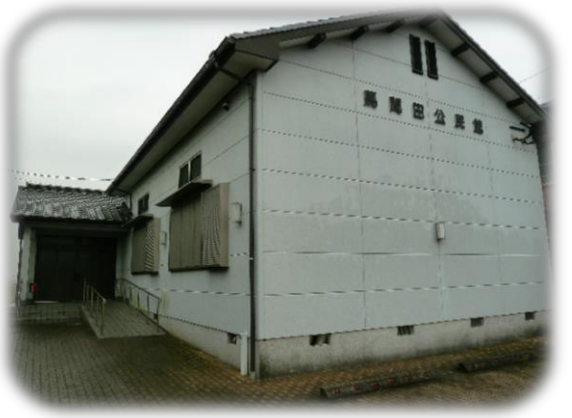
来年度より下妻校区の自主避難所となる馬間田公民館

下妻校区の皆さんは馬間田公民館、もしくは校区内のお近くの公民館などに避難することになります。