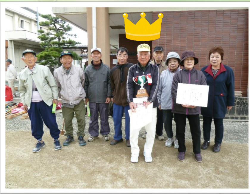
上位入賞のみなさん