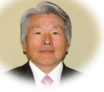
橋本区長会副会長(若菜)