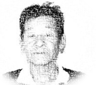
武富 校区老人会 副会長 (富重老人クラブ 寿会)