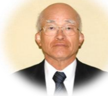
光延区長会会長(高江)