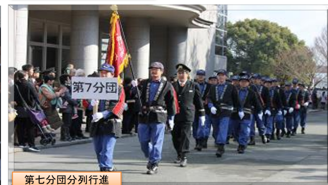
第七分団分列行進