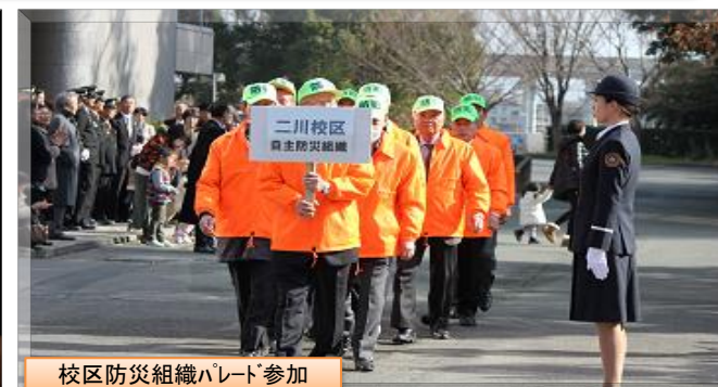
校区防災組織パレード参加