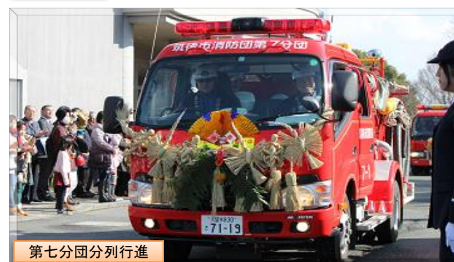
第七分団分列行進