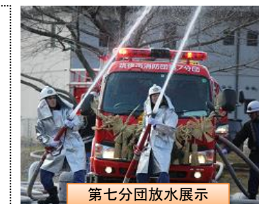
第七分団放水展示