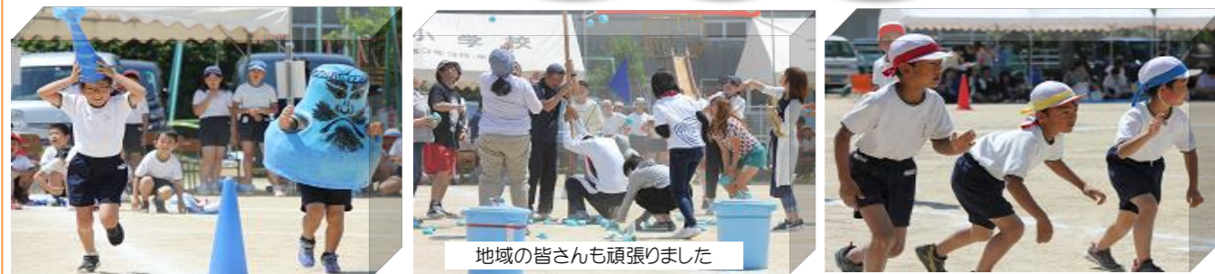
地域の皆さんも頑張りました

5月27日(土)晴天のもと二川小学校運動会が開催されました。子どもたちは、短い期間での練習であったが、スローガン「見せつけろ！100%の二川魂」のもと元気いっぱい練習の成果を出し切った結果、