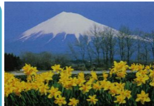
静岡県/富士市大淵