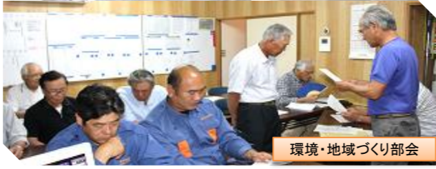
環境・地域づくり部会