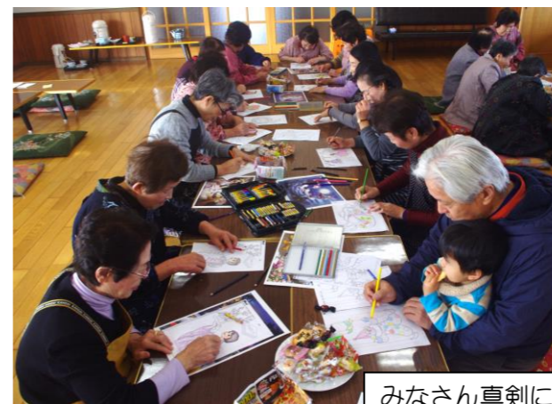
みなさん真剣に「ぬりえ」をされています

今回は、みんなで「ぬりえ」をしました。「ぬりえ」と聞くと子どもの遊びと思いがちですが、大人のぬりえは、セラピー効果があると言われ、しかも脳の活性化にも良いとされています。その後は皆さんと楽しくお話をしながら昼食をとったり、和太鼓の教室に通われているお子さんの太鼓の演奏がありました。