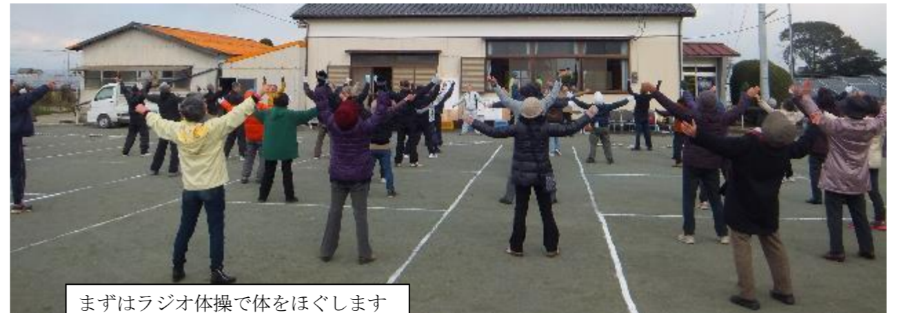
まずはラジオ体操で体をほぐします

午後からは、筑後警察署より「振り込め詐欺」筑後市役所から「マイナンバー制度」について講演をしていただきました。