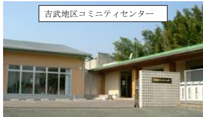
吉武地区コミュニティセンター

平成14年に自主的な組織として設立された組織で、多目的ホールや研修室2室、和室が2室、調理室、加工室までありとても立派な施設でした。