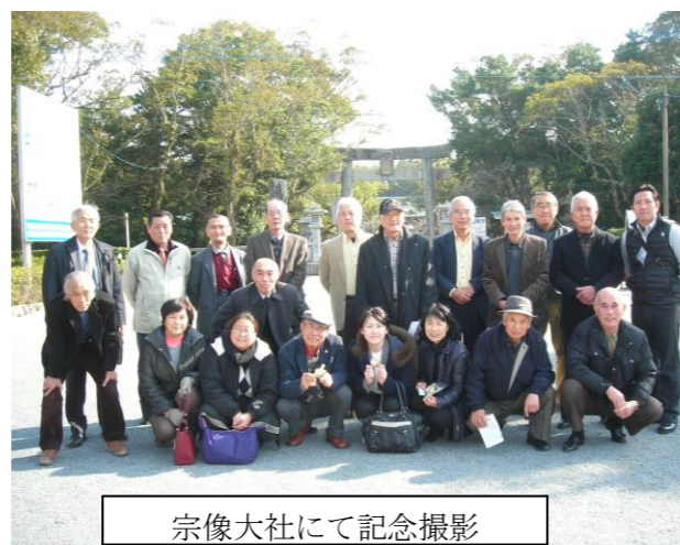
宗像大社にて記念撮影