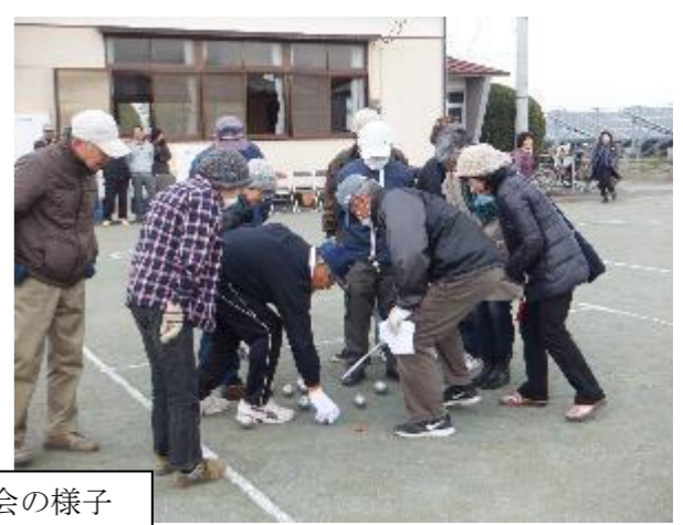
ペタンク大会の様子