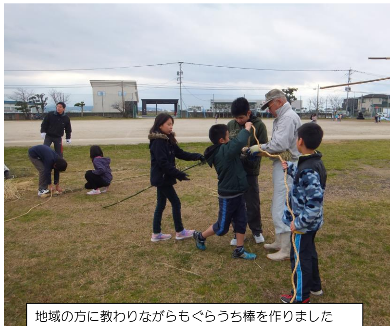
地域の方に教わりながらもぐらうち棒を作りました