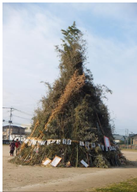
今年もこんなに大きく出来ました！