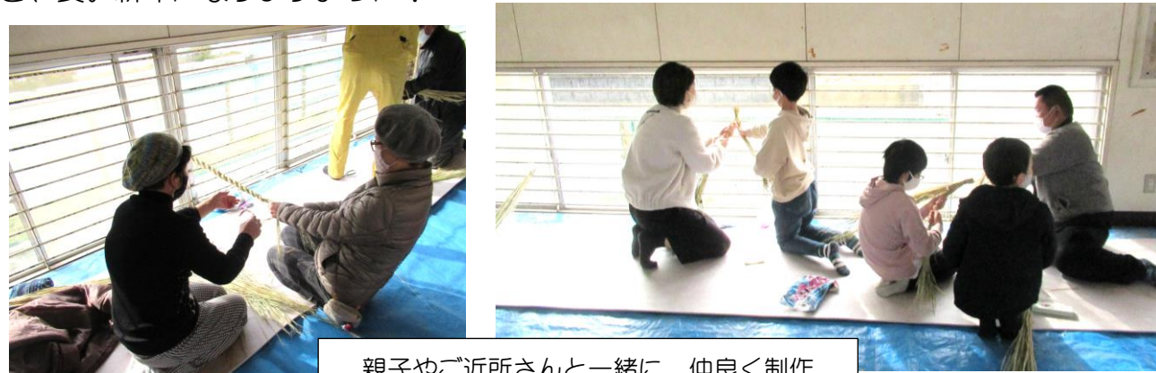
親子やご近所さんと一緒に、仲良く制作

しめ縄は新年の神様「歳神様」をお迎えするものです。自分で作ったしめ縄で歳神様を招き、良い新年になりますように！