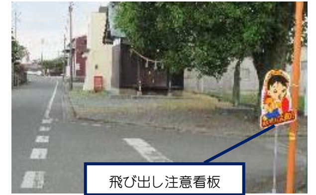
飛び出し注意看板