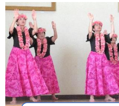
フラダンスや日本舞踊、 大正琴などを披露