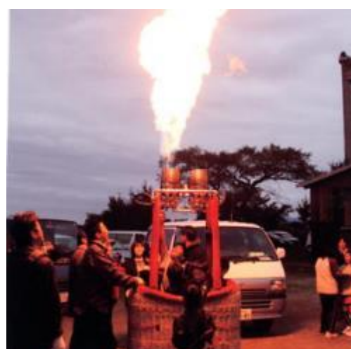
100周年記念バルーン体験（古島小学校ホームページより）

令和7年には、水田・古島・下妻小学校が再編され新しい学校が建設されます。それに伴い、古島小学校は廃校となります。いよいよ令和4年度から筑後市学校跡地利用検討委員会が立ち上がり、話し合いをされています。その他開校準備委員会も立ち上がり、開校に向けた準備が始まります。あと3年・・・新しいものにワクワクする気持ちと寂しい気持ち。5年後10年後、30年後と住み良い「古島」を目指していきたくと思います。