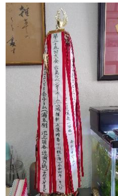
トロフィーは校長室に飾られています