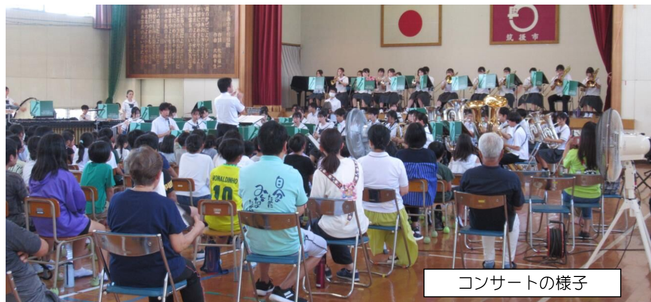
コンサートの様子

八女学院吹奏楽部は、令和4年度、「第16回マーチングバンド九州大会」予選で金賞、ルネサンス賞、九州大会出場獲得。「マーチングステージ全国大会」優秀賞受賞。「マーチングステージ全国大会」九州予選で金賞受賞、九州代表の実績があります。