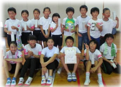
★優勝 水田上町子ども会★

子ども達が元気いっぱい、集中力もあり、真剣になり団結力もあって、とても白熱した試合で盛り上がり良かったなと思います。来年以降も続けていきたいと思っておりますので、参加のほどよろしくお願いたします。