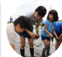
6年生がやさしく教えてくれました