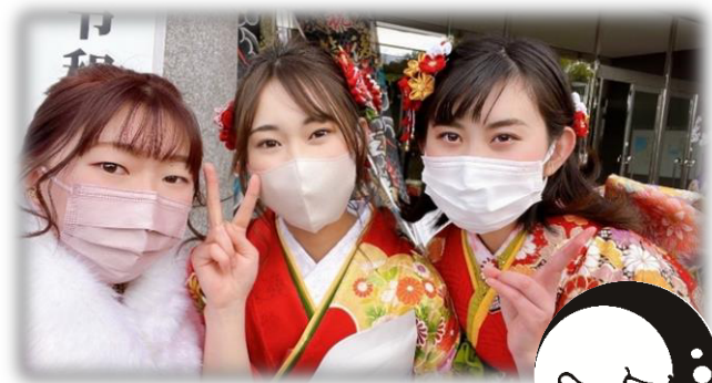
しもつま すりーびゅーていーす 担当:

風みどり 1月9日筑後市の成人式に我が家の三女も出席しました。振袖姿はやはり晴れやか。民族衣装なのに今は着る機会が少なくて残念だなあと感じます。かくいう私は、振袖は競争になるから遠慮してくださいという地域(時代)で着られずじまい。新成人を羨ましく眺めました。 今年は振袖にブーツという目新しい姿もあり、時代の流れを感じます。成人とはいえまだ二十歳、先は長く可能性は未知。やっぱり羨ましい! 時代の流れに揉まれつつ、ささやかでも楽しむことを忘れずに、とエールを送ります。