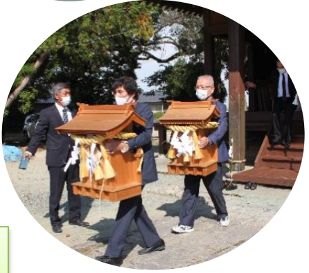
今年も各地区で神座祭が執り行われました。