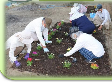
中牟田区では『緑の募金』助成事業の一環として公民館に花苗を植えました。

今年も恒例の団内大会が行われました。 緊急事態宣言のため体育館が使用中止になっていましたが、各自で練習を重ね、大会に臨みました。 低学年(園児~4年)と高学年(5,6年)に分かれての総当たり戦。中学生が審判を手伝ってくれました。 練習不足で思うように動けない子もいて、結果は悲喜こもごも。それでも、みんな精一杯戦いました。 締めめの親子剣道の時には、6年生とその保護者の勝負を笑顔で応援しました。 この夏から新たに6人の新入団員を迎え、ますます活気づく下妻剣道。12月には剣道教室を行いますので、興味のある方はぜひ来て下さい。