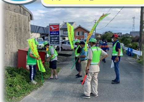
中牟田区で消火栓点検