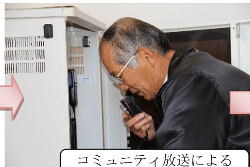
コミュニティ放送による区民への避難指示の伝達