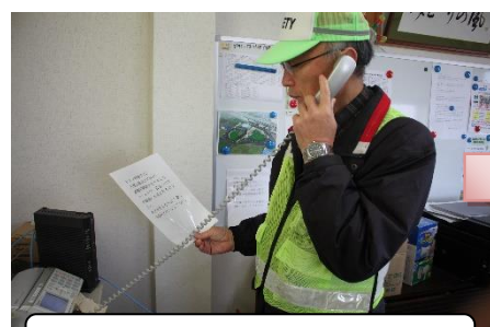
市役所からの避難指示の伝達