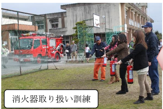
消火器取り扱い訓練