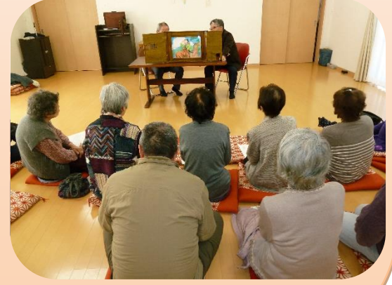
郷土史研究会講師による紙芝居