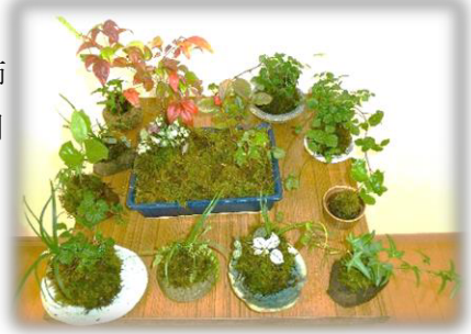
力作揃いの苔玉作品

午後からは皆さんで苔玉を作りました。南天や龍のひげを使って個性豊かな苔玉を作られていました。玄関などに飾ったら素敵ですね。