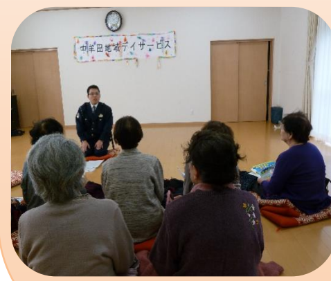
馬間田駐在さんのお話