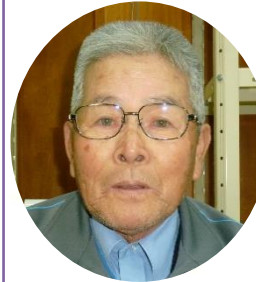
中牟田行政區長 塚本 征治