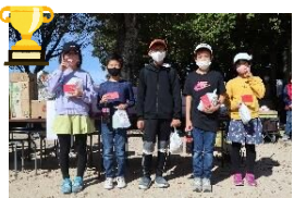
【子ども上位入賞者】