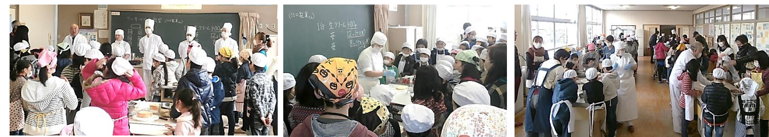
よろしくお願いします!