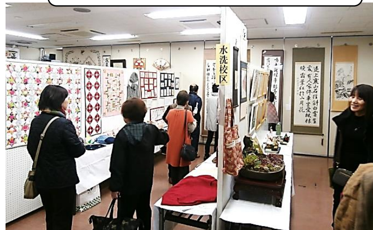
みなさんの素晴らしい作品に、多くの方が関心されていました。来年もお願いします。