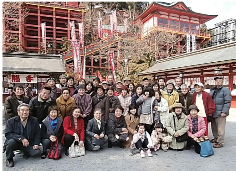
祐徳稲荷神社にて、みなさんいい笑顔ですね

また、来年度は何をやるのか決まっていますが、皆さんが楽しめるようなものを企画しようと思っておりますので、よろしくお願いします。