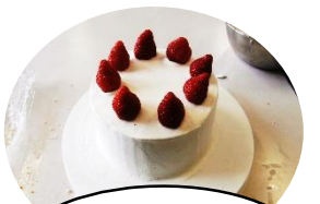
出来上がったケーキ

最初に、全体的な説明をしていただき、6班に分かれ作業開始。みんなで協力しながら作業を進め、分からないところや難しいところは、講師の先生方や保護者の方々に支援してもらいながら、たくさんの作業をこなしていきました。