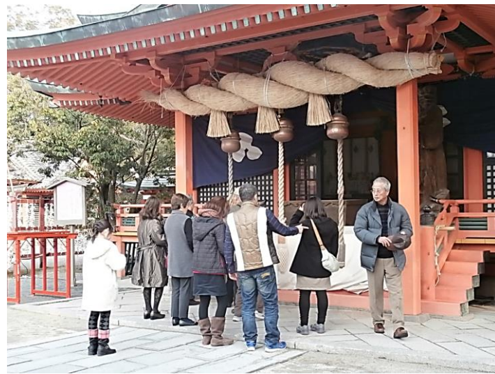
風浪宮にて、何を願いましたか？