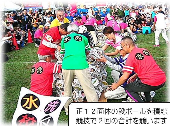
正12面体の段ボールを積む 競技で2回の合計を競います

9月19日(土)、ちっご祭り地域対抗イベントに「水洗校区コミュニティ協議会」として出場しました。役員の方を中心に地域の方にも参加していただき、結果は32チーム中8位でした。ぶっつけ本番の競技でしたが、皆さんの息の合ったチームプレーでとても楽しく出来た事を報告します。