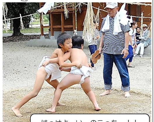
はっけよーい、のこったー！！ 二人とも、頑張れー。