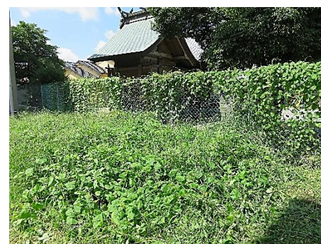
グラウンドに草が大量発生！保護者の方と子ども達で作業中です。

ラジオ体操終了後、水洗小学校の愛校作業が行われ、親子での学校の清掃が行われました。コミュニティ協議会では、学校の敷地内に設置している「防災倉庫」周辺の草刈りやフェンスに絡まった朝顔や草取りを役員さんに行っていただきました。