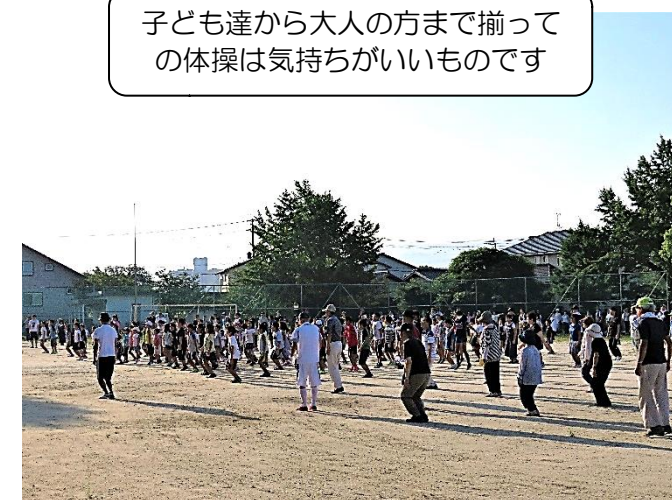
子ども達から大人の方まで揃っての体操は気持ちがいいものです

ラジオ体操終了後、水洗小学校の愛校作業が行われ、親子での学校の清掃が行われました。コミュニティ協議会では、学校の敷地内に設置している「防災倉庫」周辺の草刈りやフェンスに絡まった朝顔や草取りを役員さんに行っていただきました。