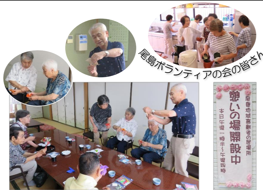
尾島ボランティアの会の皆さん

その後、ボランティアさんが淹れたお茶をいただきながら、折り紙作品作りの話で盛り上がりしました。