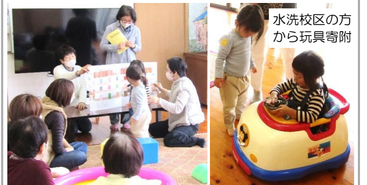
水洗校区の方 から玩具寄附

11月27日（月）、船小屋公民館において、5組10名、スタッフ等10名が集いサロンを楽しみました。親子で色鮮やかな絵本の世界を楽しんだり、お友だちと寄附された玩具で遊んだりしました。