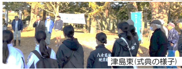
津島東(式典の様子)