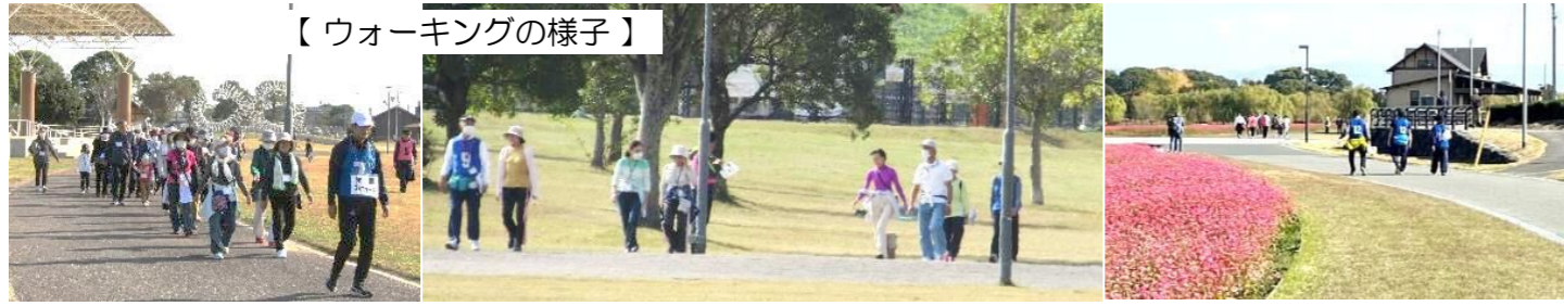
【ウォーキングの様子】