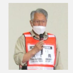
避難所運営班の役割確認(平常時・応急対策時)