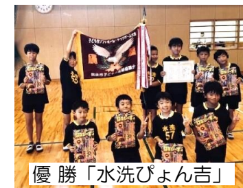
優勝「水洗びよん吉」

6月3日(土)、標記大会が開催されました。水洗校区からは5チーム48名が出場しました。熱戦の試合結果は、「水洗びよん吉」が見事に優勝し、大きな優勝旗を授与されました。皆で喜びを分かち合いました。