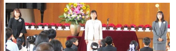
【 1年生 学級担任紹介 】