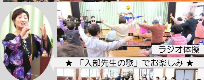
★ 「入部先生の歌」でお楽しみ ★