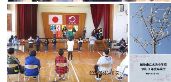
【6年生を送る会の様子】 【卒業記念植樹】

筑後市・筑後警察署・筑後市交通安全協会 連携 春の交通安全県民運動2022 出動式 開催