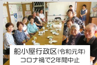
船小屋行政区(令和元年) コロナ禍で2年間中止