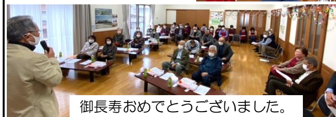
御長寿おめでとうございます。